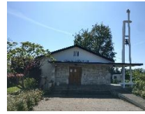
Ste Marie- Madeleine