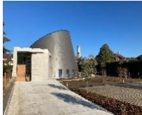
St Jean Baptiste