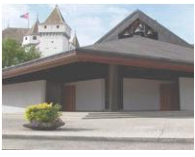
Notre-Dame de l'Immaculée Conception