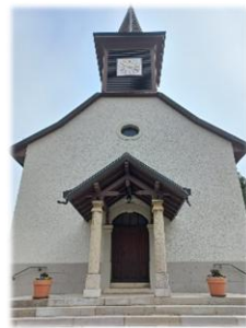
Communauté du Haut messes à l'église de Cheseaux secrétariat : ch. du Village 9 1032 Romanel-sur-Lausanne communautcatholique@bluewin.ch