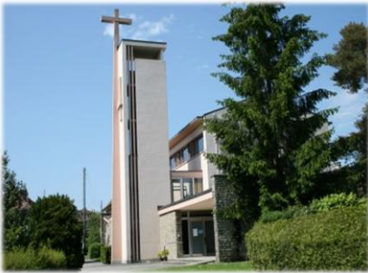
Paroisse du Bon Pasteur avenue des Cerisiers 2 1008 Prilly +41 (0)21 634 92 14 paroisse.prilly@cath-vd.ch