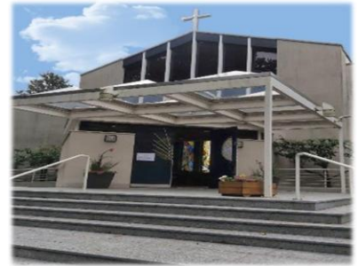
Paroisse de St-Joseph avenue de Morges 66 1004 Lausanne +41 (0)21 624 45 55 paroisse.lausanne.st-joseph@cath-vd.ch