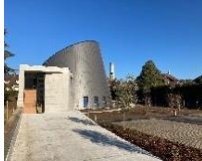
St Jean Baptiste