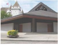
Notre-Dame de l'Immaculée Conception