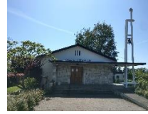
Ste Marie- Madeleine