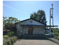
Ste Marie- Madeleine