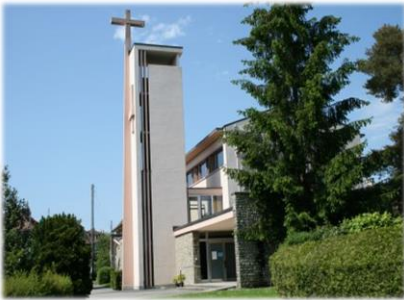
Paroisse du Bon Pasteur avenue des Cerisiers 2 1008 Prilly +41 (0)21 634 92 14 paroisse.prilly@cath-vd.ch