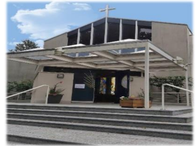
Paroisse de St-Joseph avenue de Morges 66 1004 Lausanne +41 (0)21 624 45 55 paroisse.lausanne.st-joseph@cath-vd.ch