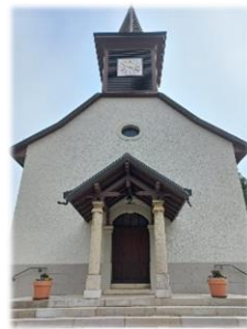
Communauté du Haut messes à l'église de Cheseaux secrétariat : ch. du Village 9 1032 Romanel-sur-Lausanne communautcatholique@bluewin.ch