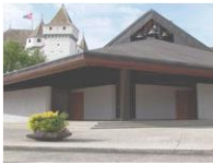
N.-D. de l'Immaculée Conception