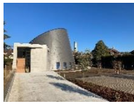
St Jean Baptiste