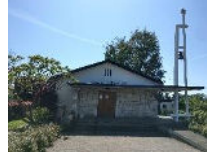
Ste Marie- Madeleine