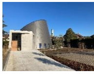
St Jean Baptiste