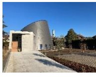
St Jean Baptiste